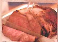
かづの短角牛 〔秋田県畜産農業協同組合鹿角支所〕