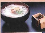
稲庭うどん 〔湯沢市〕