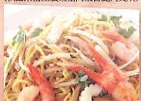
男鹿しよつる焼きそば 〔男鹿市商工会〕