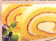
米粉スイーツ 〔(株)四季業〕