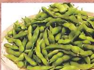
あきた香り五葉(枝豆)