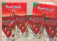
シシリアンルージュピュール 〔横手市〕