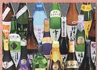
地酒 〔秋田県酒造協同組合〕