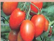
シシリアンルージュ(トマト)