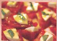
トマト/チーズ 〔なるせ加工研究会/明通りチーズ工房〕