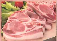
十和田湖高原ホーク桃豚 〔ホーパークラフト〕