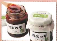
幹果の栗(すいか糖) 〔おものがわ夢工房〕