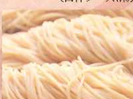
米粉麺 〔南近藤製麺所〕