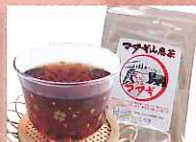
マタギ山恵茶 〔マタギの里かんじき工房〕