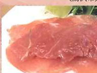
生ハム 〔白神フーズ(株)〕