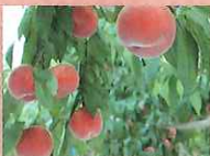
かづの北限の桃 〔かづの農業協同組合〕