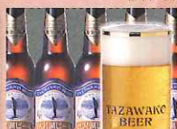
地ビール 〔田沢湖ビール〕