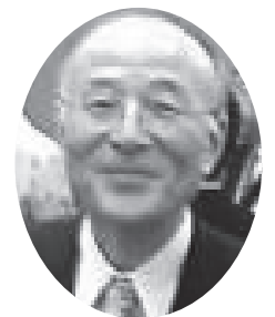
橋本五郎 読売新聞