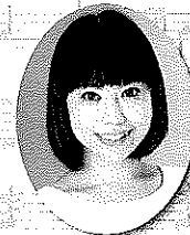
朗読(俳優) 幸田尚恵