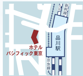
JR、新幹線、京急線の品川駅高輪口から徒歩3分